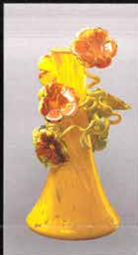
VENETIAN 1996年 デイル・チーフリー © 2022 Dale Chihuly Arts, New York / MOMI, Tokyo © 2022