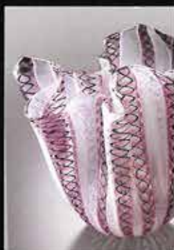
FAZZOLETTO (ハンカチ) 部分 1950年頃 山本 啓