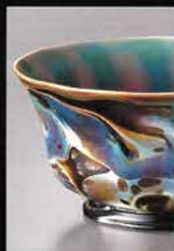
アヴァンチュゼン・マーブル・グラス罎 (部分) 17世紀 山本 啓