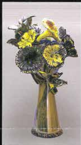
VENETIAN 1996年 デイル・チーフリー © 2022 Dale Chihuly Arts, New York / MOMI, Tokyo © 2022