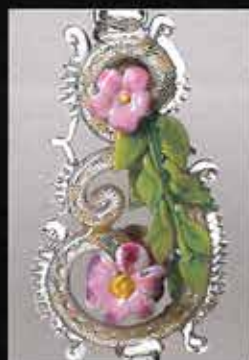
花長巻模ゴブレット (部分) 1950年頃 山本 啓

夏 2022.4.29 ~ 9.4 秋 9.10 ~ 10.30 冬 11.3 ~ 12.25 春 2023.1.21 ~ 4.16