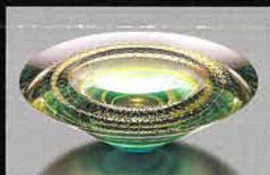
鎌倉朝子花道「自然」 2018年 / 山本 啓

約4000年前に生み出され、人々を魅了し続ける人工の素材、ガラス。20世紀に入るとガラスは装飾品や工芸の分野だけではなく、芸術表現の分野でも可能性を秘めた素材として注目を集め、芸術家自らがガラスを操って制作したアート作品が誕生しました。本展では、先駆的な海外のガラス作家の作品とともに、日本国内の現代ガラス作家たちの作品をご紹介します。作家たちを取り巻く背景は違えど、ガラスという千変万化する素材から生み出される、個性豊かで時に響き合うガラス・アートの世界をご覧ください。