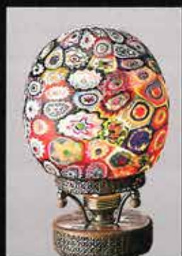
ミルフィオリ・グラス・シンブ (部分) 1910年頃 山本 啓