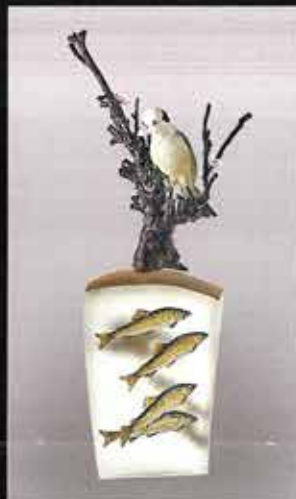
Scene of Japan 2021年 山本 啓